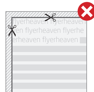
■ Fig. 2: Texte bitte immer mit einem Sicherheitsabstand zur Schneidekante anlegen. // Fig. 2: Please insert text always with a safety margin from the cutting edges.